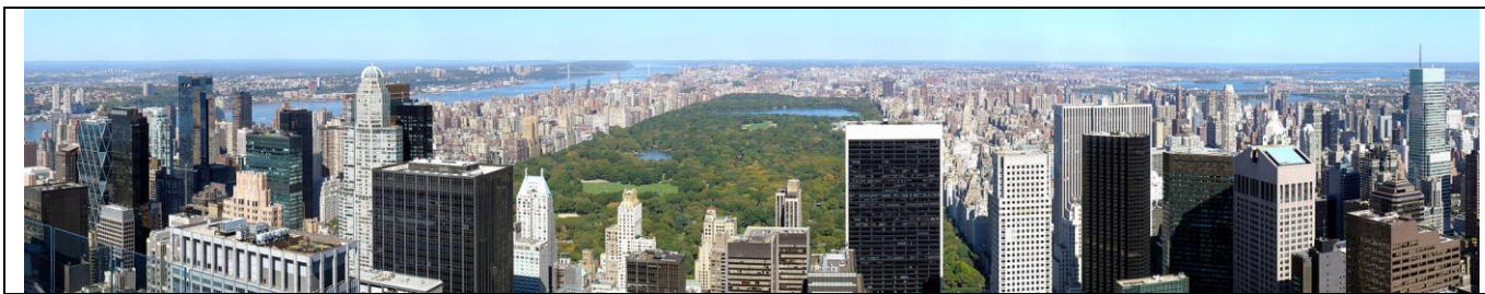
Нью-Йорк. Острів Мангеттен. Панорама острова з Центральним парком

3. Що таке спустелювання? Розкрийте його причини. Спробуйте назвати види спустелювання, тобто класифікувати це явище. Використовуючи карту ( праворуч ), назвіть головні райони спустелювання. Чи існує ризик спустелювання території України? Чому? Яким чином можна боротися з цим негативним явищем?